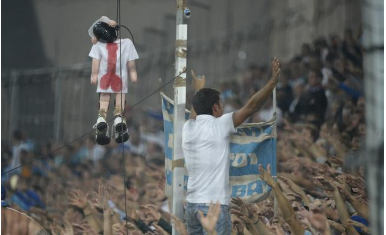
Le mannequin pendu de Valbuena a dévalorisé le club.

la solidarité collective n'est plus crédible. Au niveau de sa réputation, malheureusement ou heureusement, l'OM sera toujours surexposé médiatiquement car son expressivité passionnelle est singulière en France dans les bons et les mauvais moments.